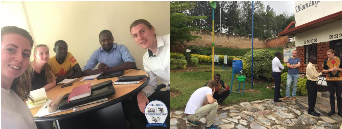
Foto 5 en Foto 6. CC-JOBS Personeel en internationale stagiaires werken vanuit het kantoor en bij Kigali Leading TVET tijdens de uitvoering van het programma.

Het belangrijkste doel van de SEP is: Integratie van kennis en ervaring van lokale Rwandese jongeren uit sloppenwijken met internationale jongeren om duurzame verbeteringen en armoedebestrijding in sloppenwijken van Kigali-Rwanda te realiseren.