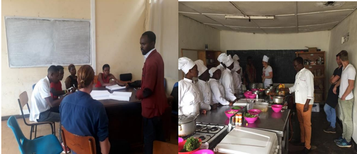
Foto 2 en Foto 3. CC-JOBS Personeel, Saxion stagiaires en lokale studenten tijdens de uitvoering van ons pilot programma.